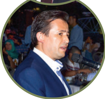
Tuzla Belediye Başkanı Şadi Yazıcı