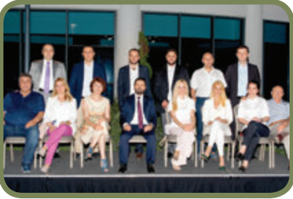
İstanbul Anadolu Yakası yönetimi, bölge sanayicileriyle iftar organizasyonunda bir araya gelme fırsatı yakaladı.